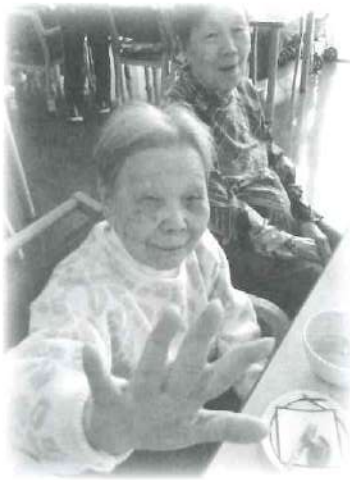
軽費の初釜の様子

茶道部出身の職員を中心に、職員が心を込めて点てたお抹茶とお菓子を召し上がっていただきました。